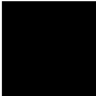
Figure 4.2 – Figure 3 : Exponentielle décroissante

Dans cette équation, N_0 est le nombre d'atomes initial, N(t) est le nombre d'atomes restant au temps t et t_{1/2} est le temps de demi-vie, c'est à dire le temps qu'il faut attendre pour que la moitié des noyaux radioactifs se soient désintégrés. Si on trace une exponentielle décroissante, on peut remarquer que le nombre d'atomes radioactifs décroît d'abord très rapidement avant de se rapprocher de plus en plus de 0 sans jamais l'atteindre lorsque le temps s'écoule.